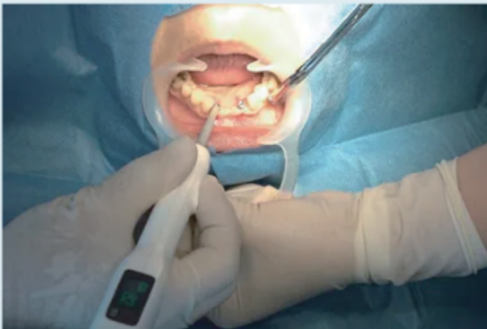
无线设计可在口腔内自由操作