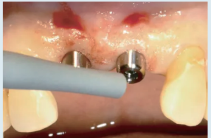
直接测量愈合余量